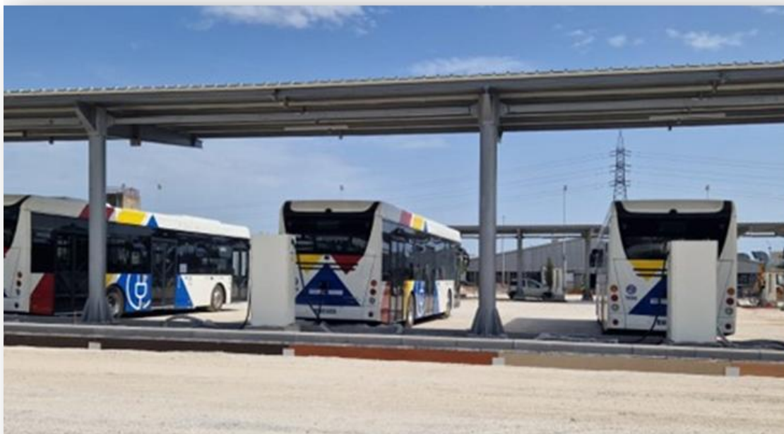
Σταθμός Φόρτισης ΟΑΣΘ