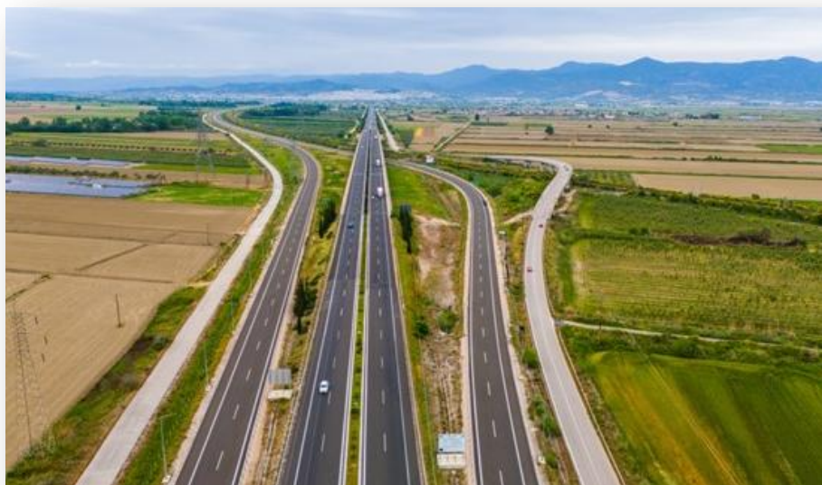
Νότιο Τμήμα Λαμία - Ξυνιάδα